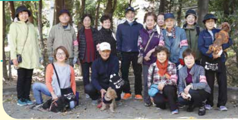
※撮影時のみマスクを外しています。

蚕糸の森・おはよう会は、1989年(平成元年)に結成されました。会員の皆さんは蚕糸の森公園に毎朝6時過ぎに集まってラジオ体操をしています。約150人の会員さんの中の有志の方々が集まり、まるでクラブ活動のように公園内の花壇のお手入れ、わんわんパトロールなどのグループを作り、楽しく児童の見守りや美化活動を行っています。