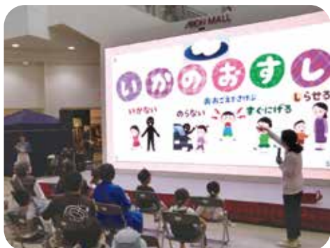
イベント会場での防犯教室