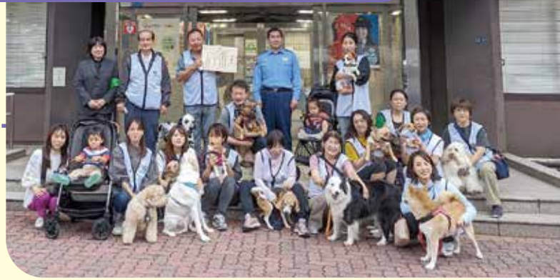
※撮影時のみマスクを外しています。

浜ランwanrun会は、わんわんパトロールを目的としたボランティア団体です。今も昔も東京の中心「日本橋」。伝統と新しさが調和するこの地域を、ポジティブな愛犬家の皆さんと愛情をたっぷり受けて共生するワンちゃん、明るく楽しく見守っています。