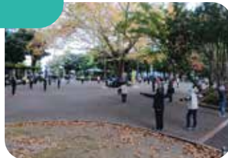
毎朝多くの方が集まり、元気にラジオ体操をしています。

蚕糸の森・おはよう会の皆さんの朝は、ラジオ体操から始まります。農林水産省の蚕糸試験場の跡地に作られた近隣の皆さんの憩いの場所「蚕糸の森公園」で毎朝元気にラジオ体操をしています。早起きとラジオ体操で心身を整えたら、朝の見守り活動のスタートです！