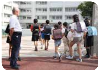
見守り活動時には校長先生がご挨拶に来てくれます。歴代の校長先生方から続く信頼関係です。