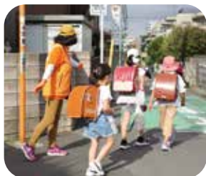
周囲の状況を見て、児童に声をかけながら見守り活動をしています。