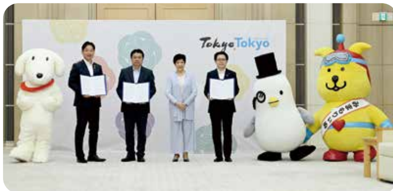
令和4年6月に行った覚書締結式の様子

事業者連携の下、親子の防犯意識向上や、地域ぐるみで子供たちの安全安心を担う社会気運の醸成を図り、犯罪や事故から子供たちを守る「見守りの輪」を広げていきます。