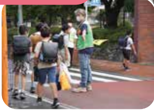
さまざまな行事やイベントを通じ、小学校との関係性を深めています。

助け合いつながり隊は、国立市立第八小学校の登校を見守っています。児童の安全を見守るのはもちろんのこと、児童やその保護者、学校やPTA、地域の方々とのつながりを作るため、毎日通学路に立っています。第八小学校の行事に参加したりイベントを企画したりするなど、児童の育成活動でも強い結びつきを持っています。