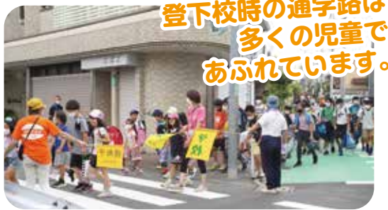
登下校時の通学路は多くの児童であふれています。

法人格 砧町自治会が見守っている世田谷区立山野小学校の児童数は、その数約1140人！世田谷区内でNo.1、東京都内を見渡しても屈指の児童数を誇ります。毎日の登校風景は壮観そのもの。法人格 砧町自治会の皆さんはもちろんのこと、山野小学校の卒業生や保護者、砧地域の皆さんと共に日々児童の安全安心な登校を見守っています。