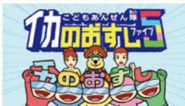
動画 イカのおすし5