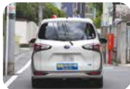
ハイブリッド車は燃費も良く静かなのでパトロールがはかどるそうです。