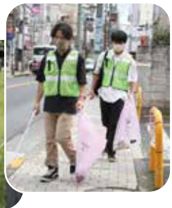
毎朝ゴミ拾いをしているので、もう拾うべきゴミがない!というくらい美化されているそうです。