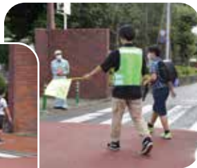
一橋大学の学生の皆さんも参加しています。