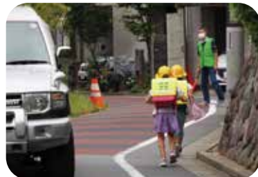
見通しの悪い場所は大きな身振りで児童に自動車の接近を伝えます。