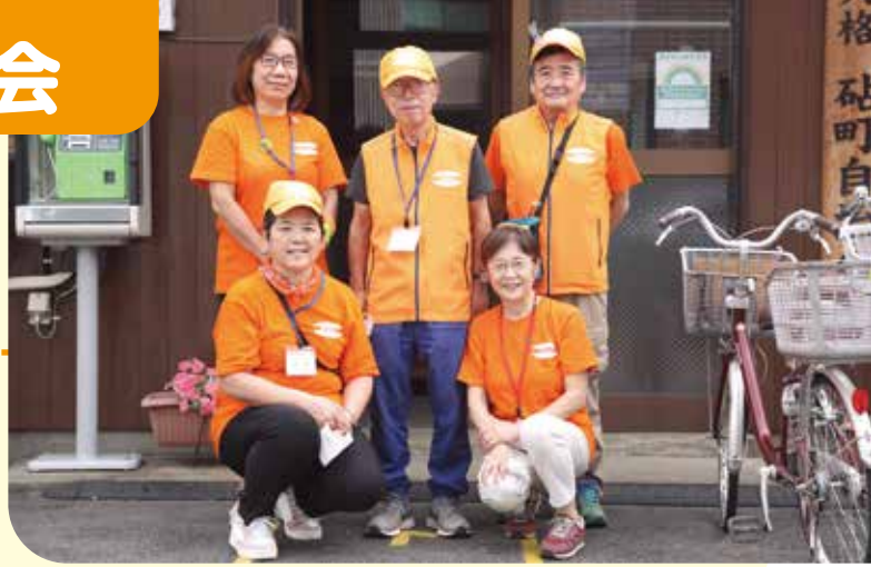
※撮影時のみマスクを外しています。

法人格 砧町自治会は、1964年(昭和39年)に発足した歴史のある自治会です。1996年(平成8年)には法人格を取得しました。自治会として所有する自前の会館を活動拠点にして、日々の見守り活動や地域活動を積極的に行っています。