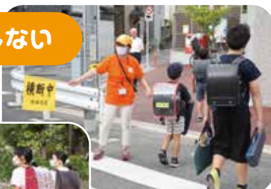
無理のない範囲で細く長く、法人格 砧町自治会の見守り活動は続けられています。