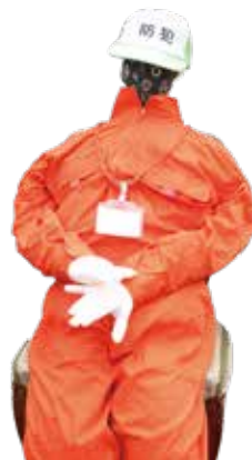
会館の入口に鎮座するのは自治会のアイドル法人君(のりとくん)。9月は防災月間なので法人君も防災仕様に变身中です。